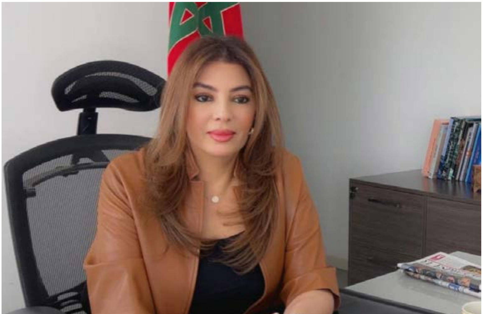
Farida Loudaya, embajadora del Reino de Marruecos para Colombia y Ecuador

E n un diálogo revelador sobre la nación marroquí, la Embajadora Farida Loudaya ofrece una perspectiva íntima y profunda de su país. A pocos días de conmemorar una de las fechas más significativas para su pueblo, la Fiesta del Trono, la diplomática nos invita a explorar no solo el significado de esta celebración nacional, sino también la evolución y los avances que han marcado el reinado de Su Majestad el Rey Mohammed VI, destacando el sólido vínculo entre el Soberano y la sociedad.