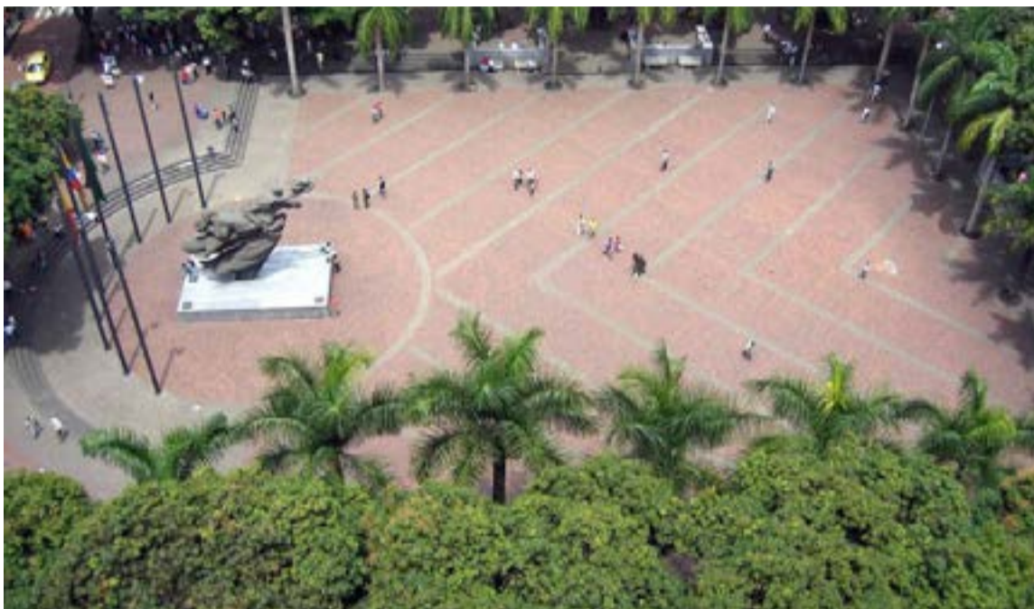
Bolívar desnuda en la plaza principal de Pereira.

P ereira, la vibrante capital del departamento de Risaralda, se erige como un punto estratégico en el corazón del Eje Cafetero colombiano. Con una mezcla única de atractivos naturales, una economía dinámica impulsada por el comercio y el emprendimiento, y una calidez humana que recibe a propios y extraños, la ciudad se consolida como un destino clave en la región.