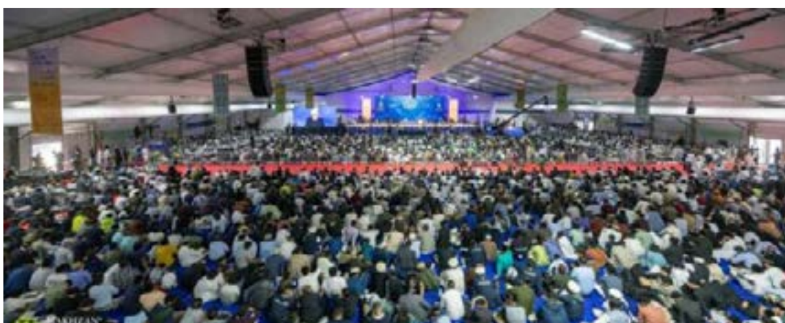
Durante la Jalsa Salana, los musulmanes de la Comunidad Ahmadí oraron junto a su líder, Su Santidad Hazrat Mirza Masrur Ahmad, el Quinto Califa y Jefe Mundial, pidiendo por la paz mundial.

L a Jalsa Salana, la convención anual de la Comunidad Musulmana Ahmadí, concluyó ayer en Hadeeqatul Mahdi, Alton, Hampshire, Reino Unido. El evento culminó con un llamado global a la paz