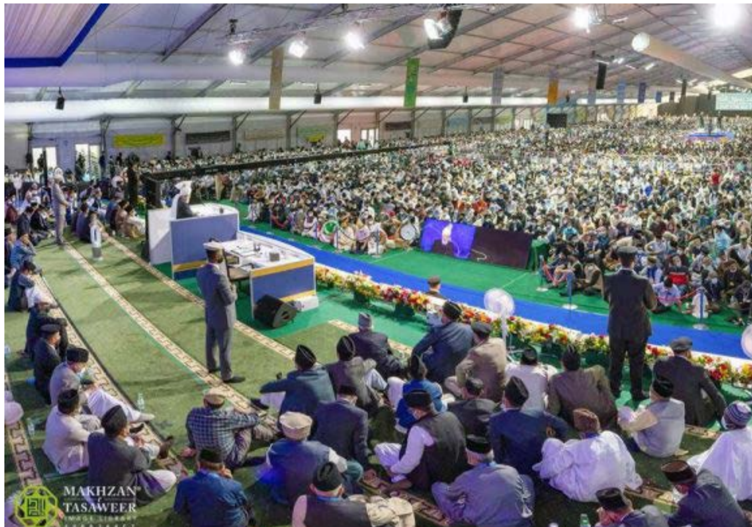
Su Santidad Hazrat Mirza Masrur Ahmad, el Quinto Califa y Jefe Mundial de la Comunidad Musulmana Ahmadía, se dirigió a más de 50 mil seguidores durante la reciente Jalsa Salana en Hadeeqatul Mahdi, Reino Unido.

sonas de más de 100 países se congregaron en este evento de tres días, dedicado al enriquecimiento espiritual, la promoción de la paz y el fomento de la unidad global. La Jalsa Salana no es solo un encuentro para los miembros de la comunidad, sino que también contó con la participación de parlamentarios, líderes cívicos y diplomáticos de diversas naciones, quienes destacaron el objetivo de la convención de fortalecer la unidad, la comprensión y el respeto mutuo.