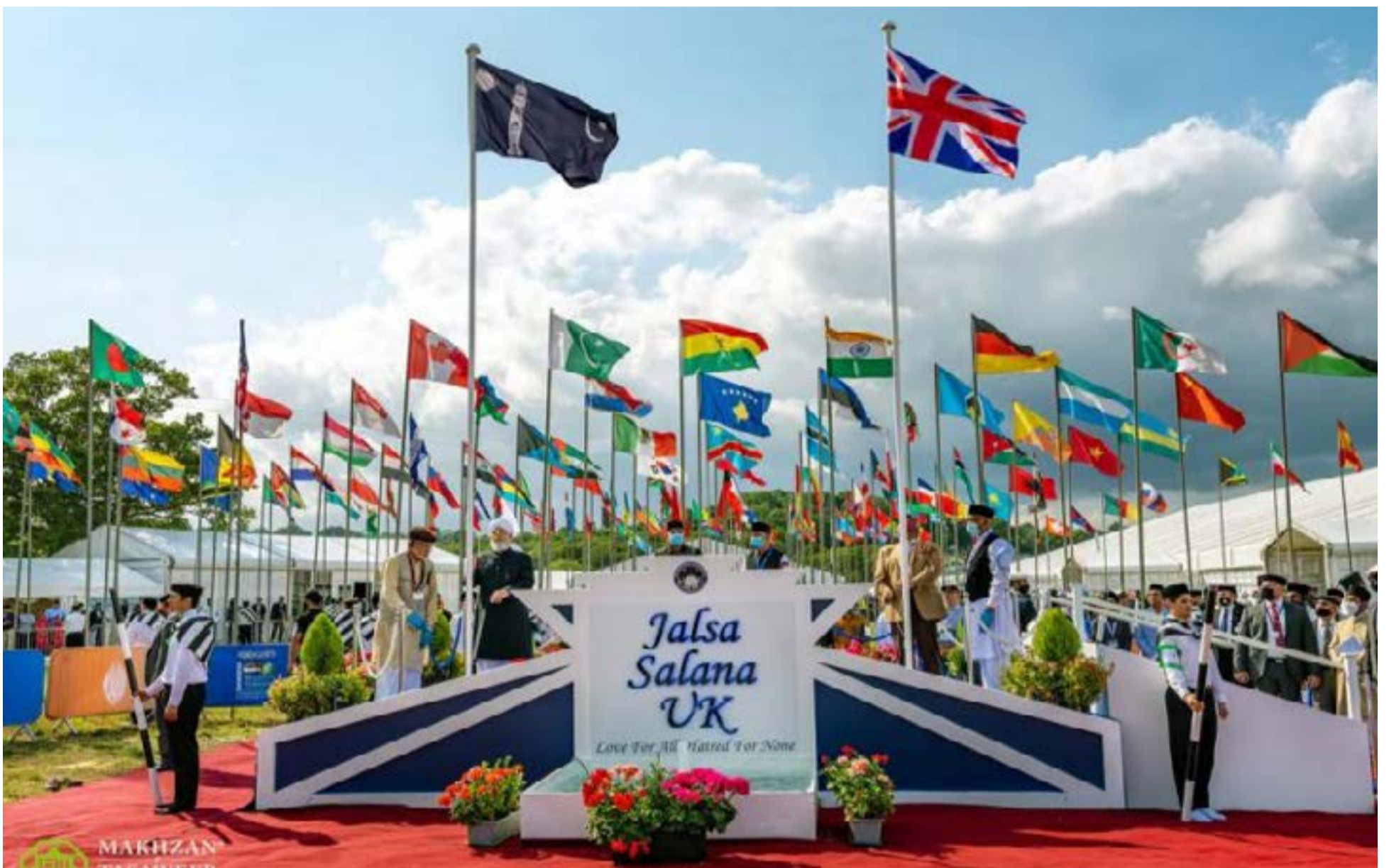
Durante la Jalsa Salana, Su Santidad Hazrat Mirza Masrur Ahmad, el Quinto Califa, presidió una plaza adornada con más de 100 banderas, simbolizando la diversidad de los países presentes en la convención anual de la Comunidad Musulmana Ahmadí.