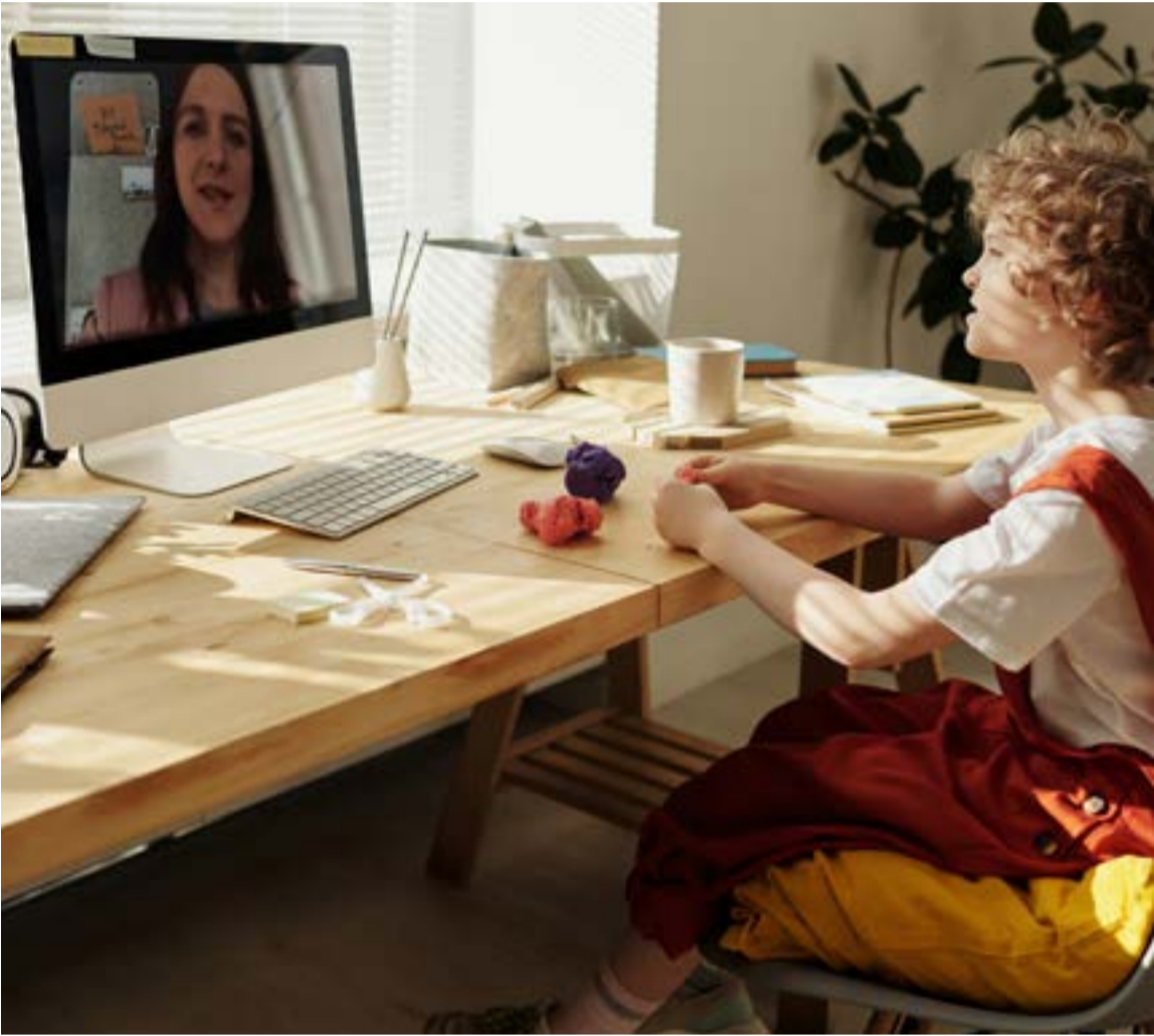
El talento creativo

Moldeando la creatividad: jugar con masas atrae a niños y adultos. Ayuda a moldear la personalidad, a inspeccionar las texturas y formas. Entonces aprender técnicas