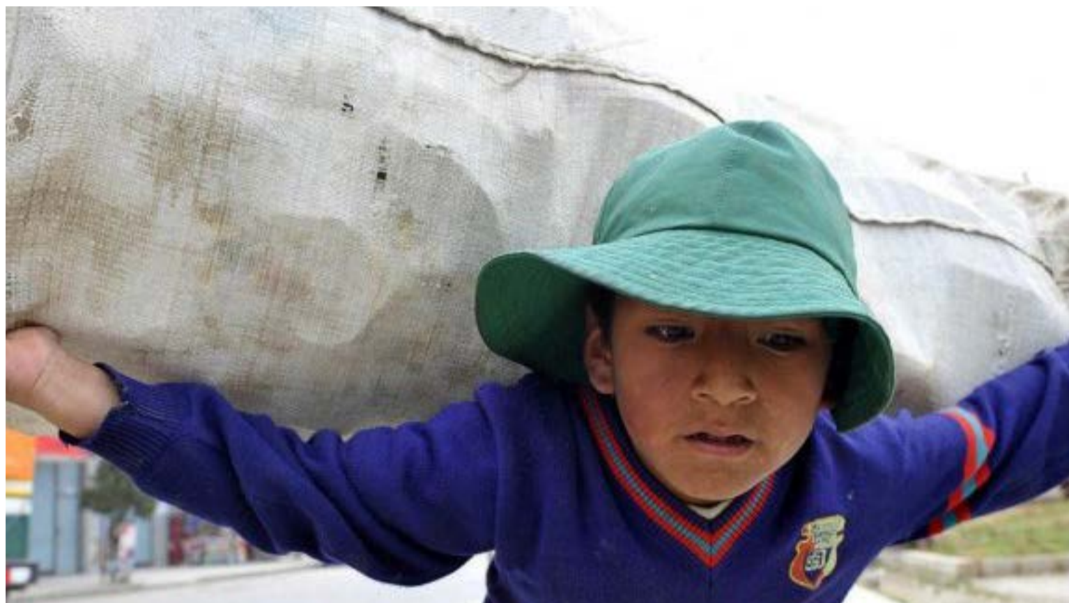
Más de 1.1 millones de niños, niñas y adolescentes realizan estas actividades por 15 horas o más a la semana

El ministro Sanguino enfatizó que, si bien la reducción de cifras es