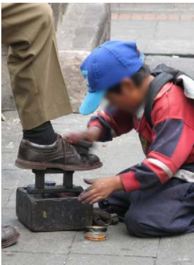
Gran Encuesta Integrada de Hogares (GEIH) del DANE, 311 mil menores entre 5 y 17 años fueron víctimas de este fenómeno en Colombia en el trimestre octubre-diciembre de 2024.

En la lucha contra este flagelo, el ministro destacó varios avances. El Gobierno ratifica su compromiso con los convenios de la OIT, como el 138 sobre la edad míni-