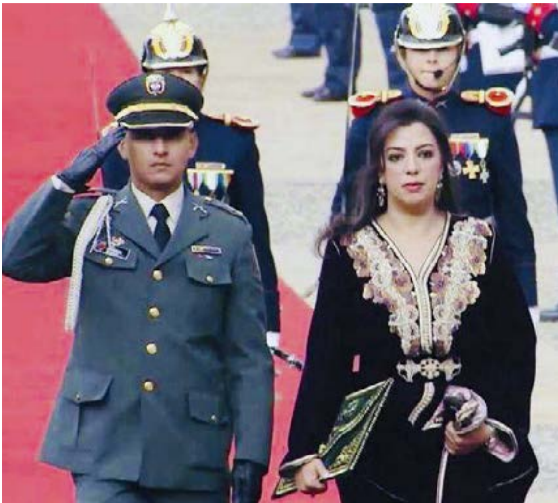
La embajadora Farida Loudaya fue investida con honores durante la presentación de sus cartas credenciales ante la Presidencia de Colombia, marcando oficialmente el inicio de su misión diplomática en el país.

—Hemos tenido grandes transformaciones en los últimos años. Hoy somos el primer productor de automóviles en África y estamos a la vanguardia en la industria aeronáutica. Además, ocupamos el segundo lugar en el