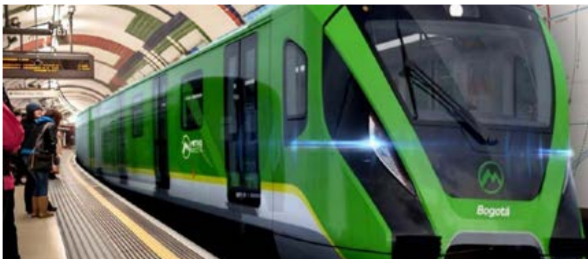
El Metro de Bogotá, sería el alimentador de Transmilenio

En capitales como Londres, el metro funciona como un sistema de ferrocarril bajo tierra desde hace 160 años. Hoy tiene 274 estaciones con una de las redes más extensas del mundo. Se mueve de lunes a domingo como sucede en algunas ciudades europeas. Diez estaciones del metro de Moscú, en Rusia, son museos subterráneos que, además de recibir la llegada de trenes, exhiben pinturas, vitrales, lámparas de cristal, mosaicos y esculturas que dejan pasmado a muchos extranjeros. No podemos compararnos bajo el rango 16-274. Tampoco nos cabe soñar con un metro que muestre sus bondades artísticas para que permanezca sin un rasguño durante cientos de años más. Pero sí habrá un metro apto para movilizar pasajeros del sur a la entrada al norte para hacer trasbordo en Transmilenio y poder llegar a su destino.